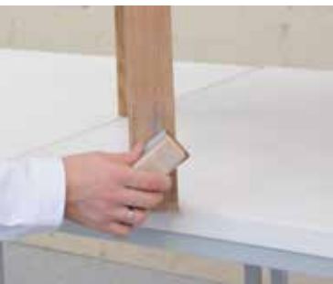
SLEFUITI SUPRAFETELE ZGARIATE